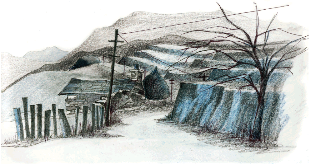
Edrych o Fwlch Llanberis tuag at Chwareli Dinorwig Dinorwic Quarries from the Llanberis Pass

Much of Dinorwig Quarry is now part of Padarn Country Park and the Welsh Slate Museum.